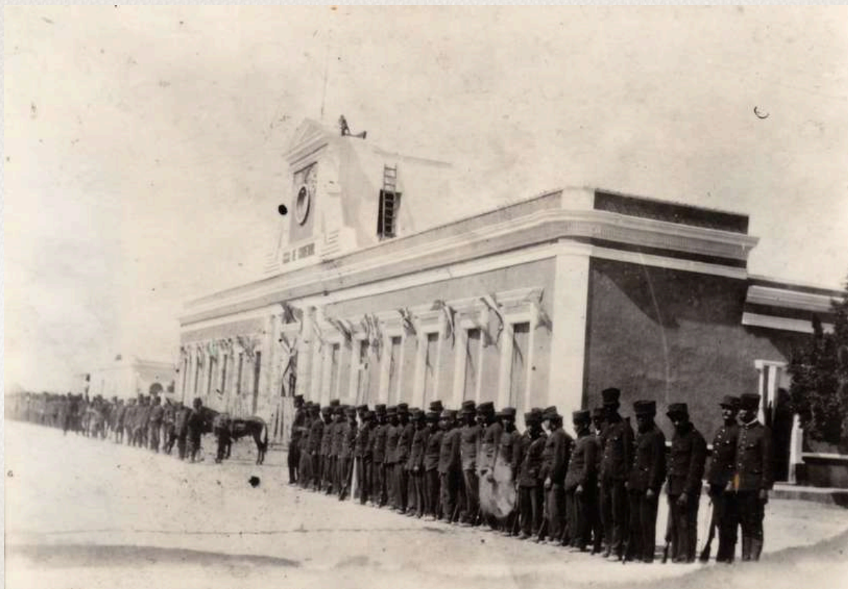
Antigua Casa de Gobierno y grupo de personas uniformadas

Fotografía con vista al antiguo Palacio de Gobierno y un grupo de personas uniformadas tomada desde la esquina de las antiguas calles Segunda y Ayuntamiento; al parecer la calle se encontraba de tierra aplanada y se alcanzan a distinguir algunas banquetas probablemente de piedra en bloque, dispuestos en posición de formación alrededor de treinta soldados en un primer grupo y en la imagen se aprecia un grupo más con aproximadamente la misma cantidad de uniformados con sus rifles y algunos caballos o mulas; al fondo la fachada frontal del icónico edificio con su letrero CASA DE GOBIERNO, adornado con banderas al parecer con motivo de alguna festividad, la escalera que daba a la parte alta donde se encontraba la campana, el asta bandera y la continuación del edificio en toda la manzana.