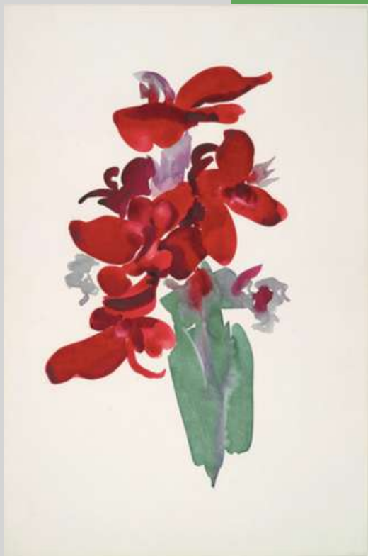
Canna roja , 1915. Imagen vía: Georgia O'Keeffe - Yale University Art Gallery, dominio público, vía commons.wikimedia.org

Durante la década de 1920 alcanzó reconocimiento nacional gracias a sus pinturas de flores monumentales y paisajes urbanos. Sus célebres representaciones florales constituyen una de las aportaciones más originales de la pintura moderna. Mediante ampliaciones extremas de pétalos, la artista eliminaba referencias espaciales convencionales y obligaba al espectador a observar detalles normalmente imperceptibles. Estas composiciones se distinguen por superficies de color cuidadosamente moduladas y una extraordinaria atención a la forma orgánica. Sus obras revelan una comprensión sofisticada de la teoría del color, empleando gradaciones sutiles y contrastes cuidadosamente equilibrados para generar profundidad y dinamismo visual.