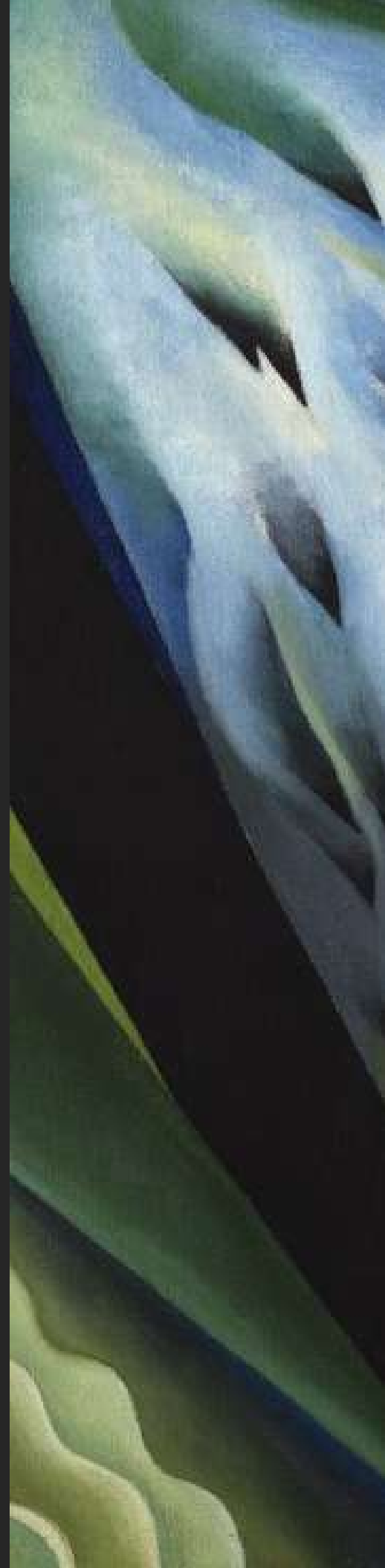
Imagen por: Georgia O'Keeffe, dominio público, vía commons.wikimedia.org

Imagen por: Alfred Stieglitz, CC0, vía commons.wikimedia.org