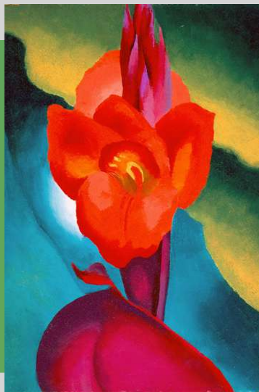
Canna roja , 1919. Imagen vía: Georgia O'Keeffe - High Museum of Art, Atlanta, dominio público, vía commons.wikimedia.org