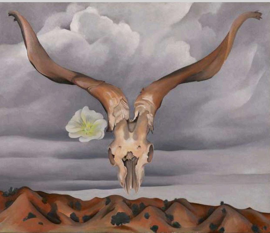
Cabeza de carnero, colinas de malva blanca , 1935. Imagen por: Georgia O'Keeffe, dominio público, vía commons.wikimedia.org

Las pinturas realizadas en Nuevo México muestran una extraordinaria capacidad de observación y síntesis. Sus célebres representaciones de cráneos animales, montañas y formaciones rocosas combinan realismo y abstracción en composiciones cuidadosamente equilibradas. La claridad de las líneas, la simplificación geométrica de las formas y el uso de amplias áreas cromáticas contribuyen a la sensación de monumentalidad que caracteriza estas obras.