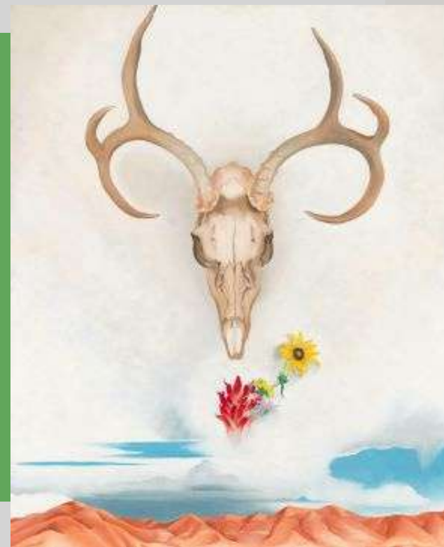
Días de verano . Imagen por: Georgia O'Keeffe, dominio público, vía commons.wikimedia.org