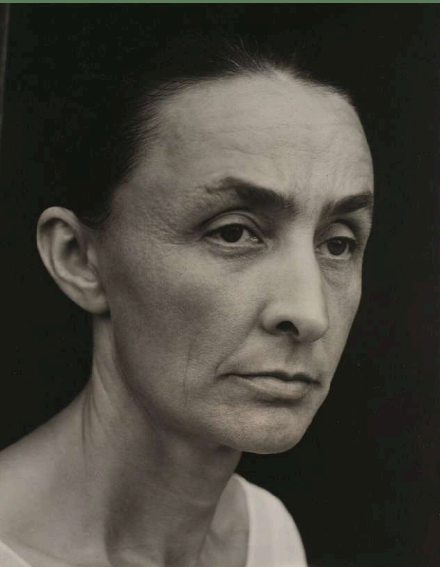
Imagen por: Alfred Stieglitz, CC0, vía commons.wikimedia.org

Imagen por: Georgia O'Keeffe, dominio público, vía commons.wikimedia.org