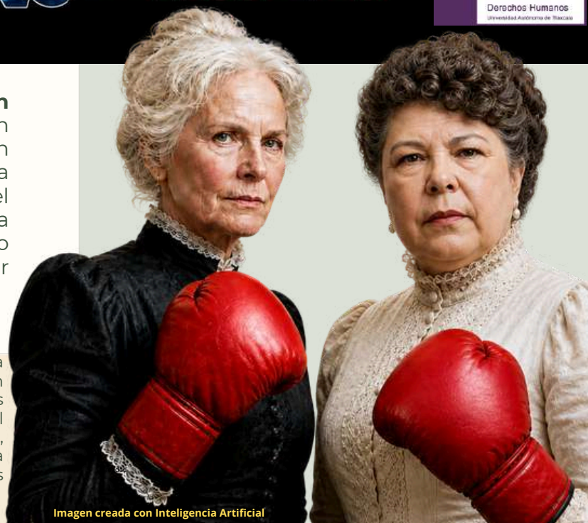
Imagen creada con Inteligencia Artificial

Desde el siglo XIX hasta la fecha, la participación de la mujer en el saber médico ha tenido una evolución creciente. A nivel mundial se estima que la inclusión de las mujeres en el ejercicio de la profesión médica oscila entre el 45% y 47% . México se encuentra en la media de esa cifra, alcanzando la paridad del 50% con la feminización de la residencia de especialización médica y del 42% en puestos de liderazgo médico.